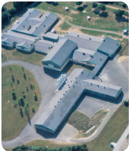
Station expérimentale porcine de l'Ifip à Romillé (près de Rennes)

Expérience reconnue de l'Ifip en expérimentation animale Possibilités d'appui pour la valorisation ultérieure des résultats