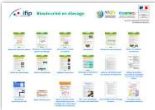
Site dédié biosécurité Ifip ( http://biosécurité.ifip.asso.fr/ )

Depuis mi 2017, la fièvre porcine africaine s'est largement répandue dans l'UE. Le nombre de cas sur sangliers ou sur porcs domestiques, a fortement augmenté (en 2018, 5 498 et 1 518 cas, respectivement). 5 nouveaux pays de l'UE ont été infectés (République tchèque, Roumanie, Hongrie, Bulgarie et Belgique) ainsi que la Chine, où la maladie a connu une extension très rapide.