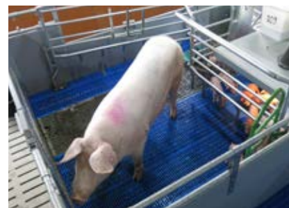
Une case liberté s'élève à environ 1600 €

D'après le sondage réalisé par l'ifop pour le compte du LIT Ouesterel, 84% des Français se déclarent favorables à la mise en place d'un label bien-être mais seulement 64% se disent prêts à payer plus cher. Augmenter les prix à la consommation nécessitera des campagnes de communication à l'intention des consommateurs pour les sensibiliser et les informer sur le contenu des labels. Certains économistes envisagent aussi une politique publique redistributive offrant aux consommateurs des revenus additionnels