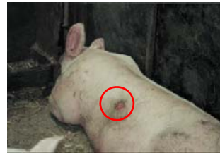
lésions + 3 cm