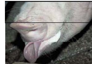
enroulement de langue

Lésions : mesure individuelle (20 anx, 2 cotés du corps); % anx avec lésions