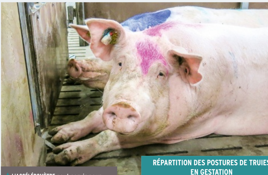
L'ACCÉLÉROMÈTRE peut servir pour diverses applications : alimentation, santé et bien-être.

L'Ifip a souhaité développer un dispositif permettant de mesurer le niveau d'activité des truies. Pour ce faire, l'institut s'est associé à RF Track, une PME rennaise spécialisée en électronique et en traitement de signal. Après trois ans d'études, ce projet a conduit à la sortie d'un accéléromètre positionné à l'oreille baptisé ActiSow. Ce produit répond à un cahier des charges strict : poids maximum de 30 g pour éviter la sensation de gêne sur l'oreille, conception robuste (matériau électronique, carénage et système de fixation), durée de vie de la pile calculée sur la base de la carrière de la truie (soit trois ans), précision des informations recueillies. Ce dispositif a été testé sur la station expérimentale de Romillé sur un groupe dynamique de 80 truies gestantes alimentées en DAC.